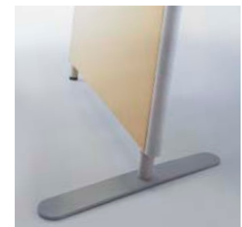
Auslegerfuß Foot Stabilisateur plat

Das vollständige Programm ist in der Preisliste abgebildet und beschrieben. Technische Änderungen vorbehalten. The complete programme is illustrated and described in the price list. Subject to technical changes without notice. Le programme intégral est illustré et décrit dans le tarif, sous réserve de toutes modifications techniques.