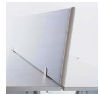
Tischaufsatz Tabletop screen Panneau personnel