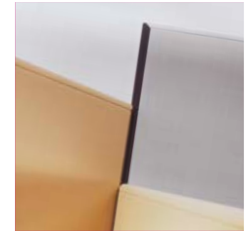
freie Winkelwahl free adjustment of angles libre choix des angles