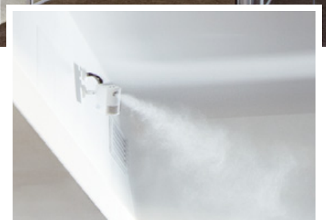
NanoFog Evolution schützt die Gesundheit und vitalisiert