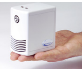
NanoFog Evolution: passt in jedes Gebäude