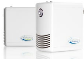
Vier Vernebler der Serie „NanoFog Evolution“ sichern ganzjährig eine optimale Luftfeuchtigkeit im neuen JURA-Gebäude

Wasseraufbereitungseinheit und dem Check des gesamten Systems garantiert DRAABE einen störungsfreien und hygienisch sicheren Einsatz der Luftbefeuchtungsanlage. Für JURA als Anwender ist das System daher wartungsfrei.