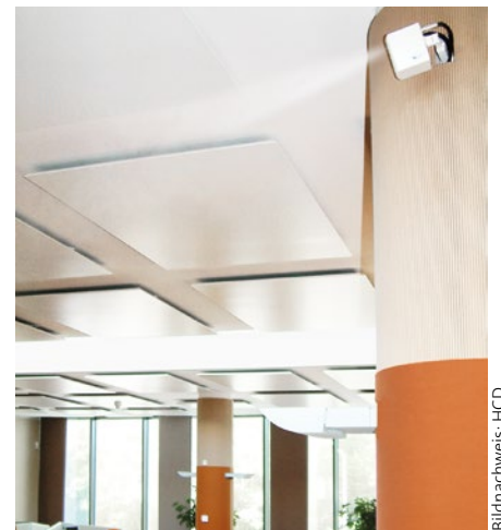
Nahezu unsichtbar: kleine DRAABE NanoFog Vernebler sorgen für eine optimale Luftfeuchtigkeit